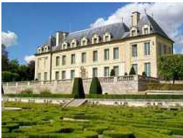
Déjeuner « impressionniste » au château

La ville d'Auvers s/Oise doit sa renommée internationale aux peintres paysagistes et surtout impressionnistes , Charles-François Daubigny , Paul Cézanne , Jean-Baptiste Corot , Camille Pissarro et Vincent van Gogh qui sont venus puiser ici leur inspiration. On y retrouve la plupart des sites qu'ils ont immortalisés. Vincent Van Gogh y a peint soixante-dix de ses toiles au cours des derniers mois de sa vie.